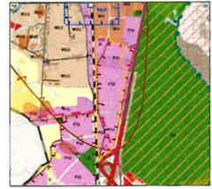
skala 1:20 000