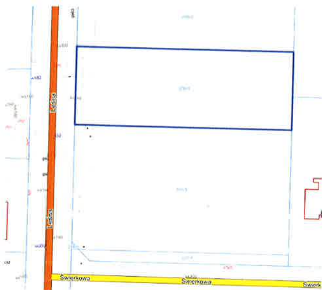
działka nr 206/4