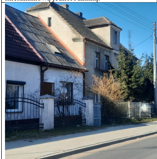
Fot. 7. Zabudowa mieszkaniowa przy ul. Tysiąclecia.