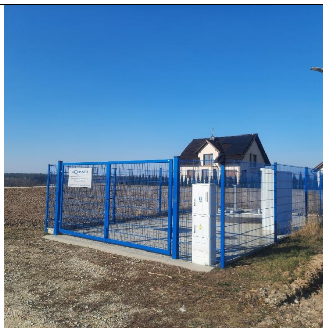
Fot. 6. Przepompownia przy ul. Akacjowej.