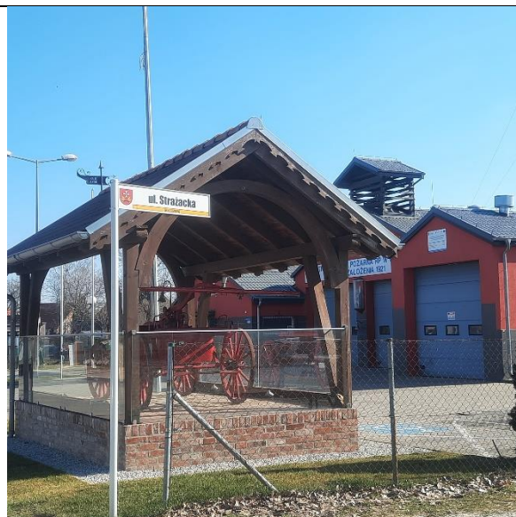
Fot. 2. Teren remizy strażackiej.