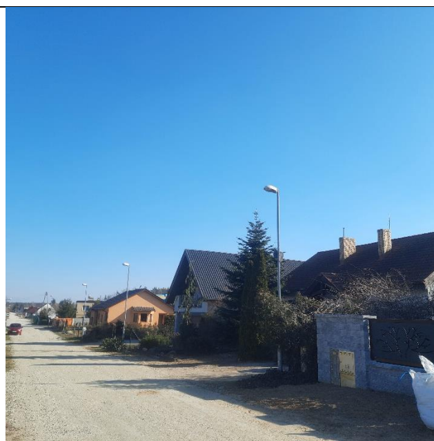
Fot. 8. Widok na nową zabudowę mieszkaniową jednorodzinną przy ul. Akacjowej.