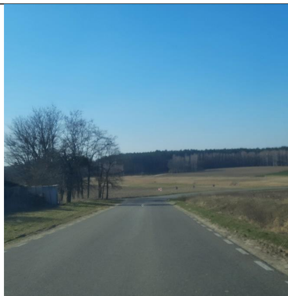
Fot. 4. Widok na tereny zieleni otwartej na zachód od obszaru opracowania.