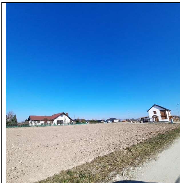
Fot. 5. Widok na nową zabudowę mieszkaniową jednorodzinną.