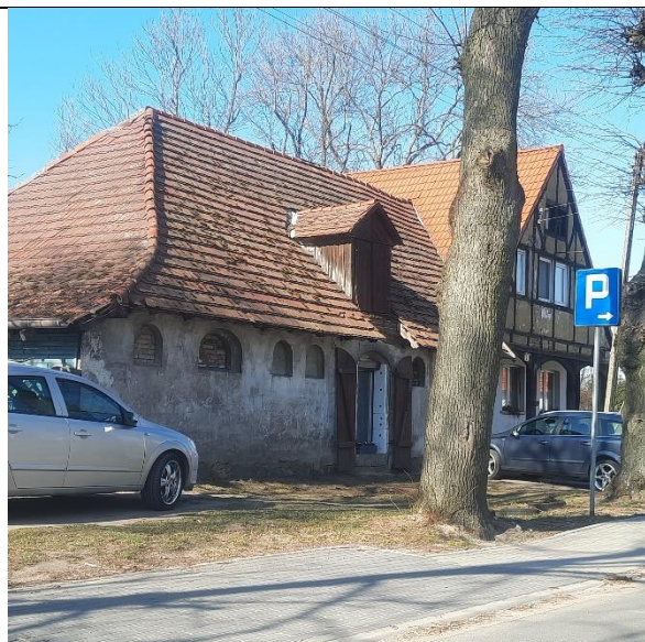
Fot. 1. Zabytkowa zabudowa przy skrzyżowaniu ulic Dworcowej i Lipowej – budynek dawnej gospody.