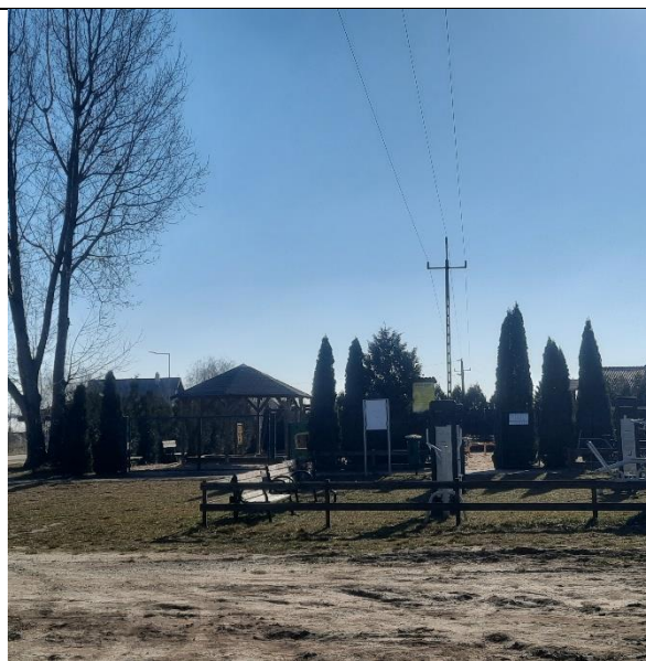
Fot. 3. Tereny sportowo – rekreacyjne – siłownia zewnętrzna.