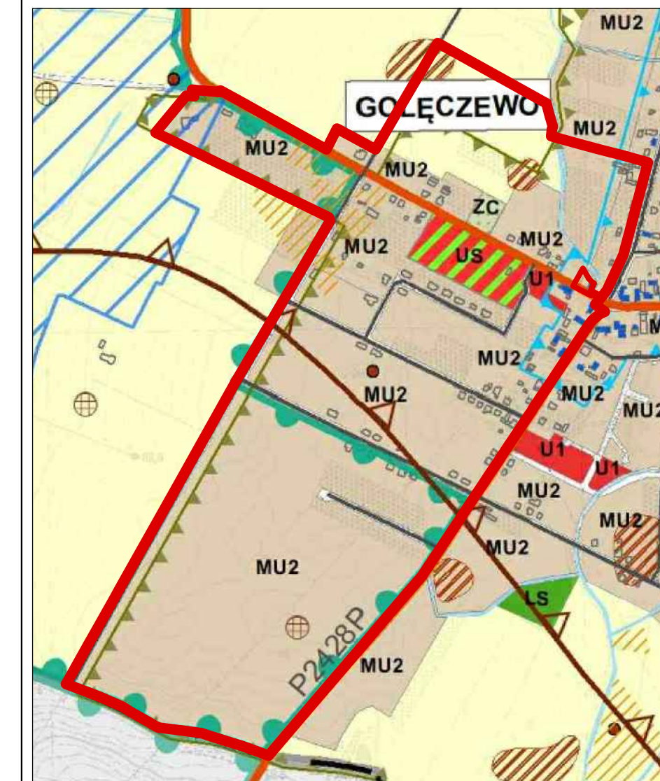
WYRYS ZE STUDIUM UWARUNKOWAŃ I KIERUNKÓW ZAGOSPODAROWANIA PRZESTRZENNEGO GMINY SUCHY LAS skala 1 : 10 000