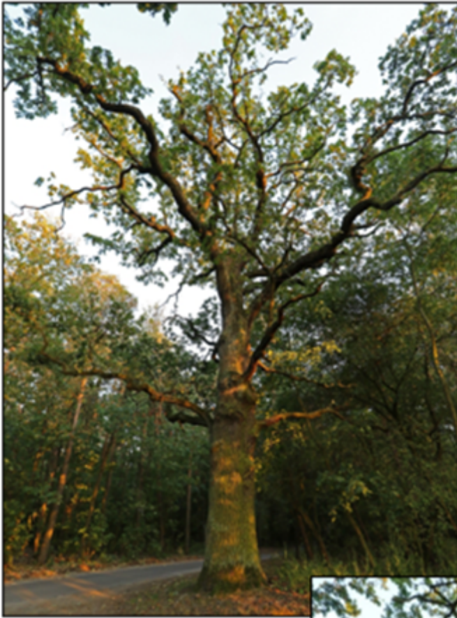
wrzesień 2019 r.

Załącznik Nr 2 do uchwały Nr LVIII/682/23 Rady Gminy Suchy Las z dnia 25 maja 2023 r.