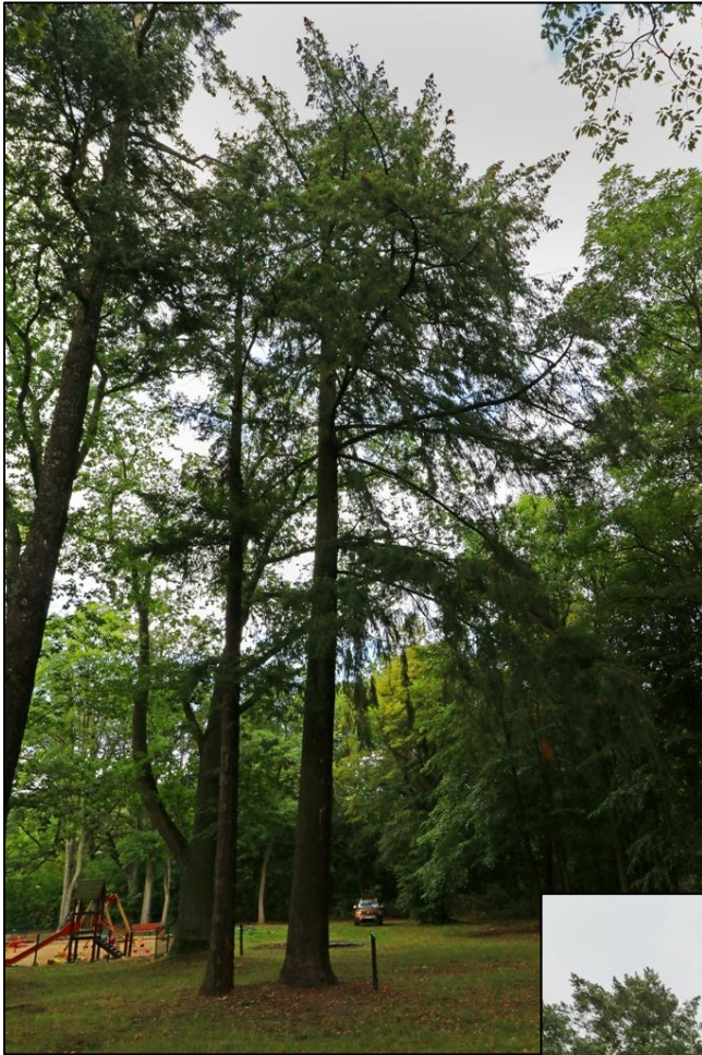
wrzesień 2019 r.

Załącznik Nr 2 do uchwały Nr LXVII/787/24 Rady Gminy Suchy Las z dnia 29 lutego 2024 r.