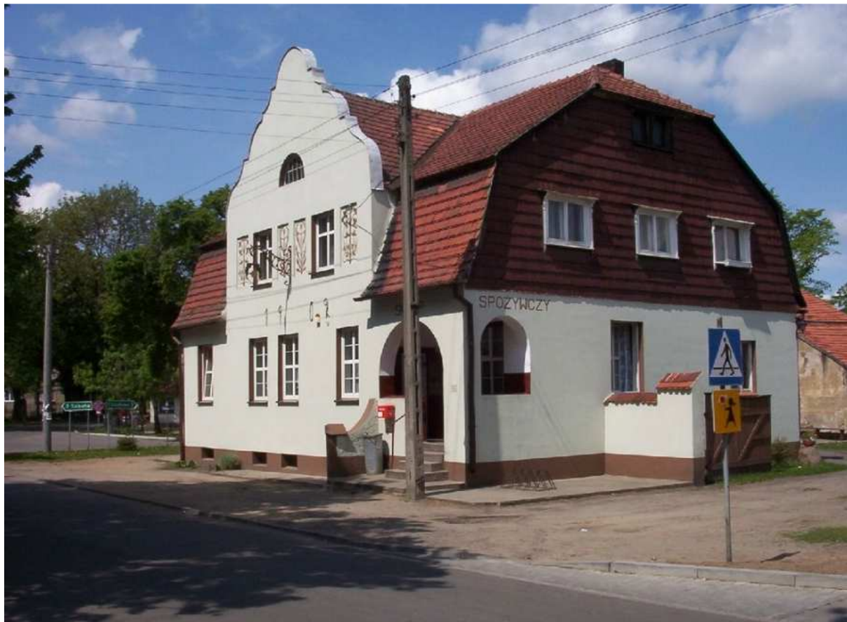
Dawna karczma 2012 rok.

zegarową. Dotąd zachowało się kilka budynków mieszkalnych oraz użyteczności publicznej m. in. Stara Karczma w której obecnie mieści się sklep spożywczy. Większość historycznych obiektów jest wpisana do rejestru zabytków.