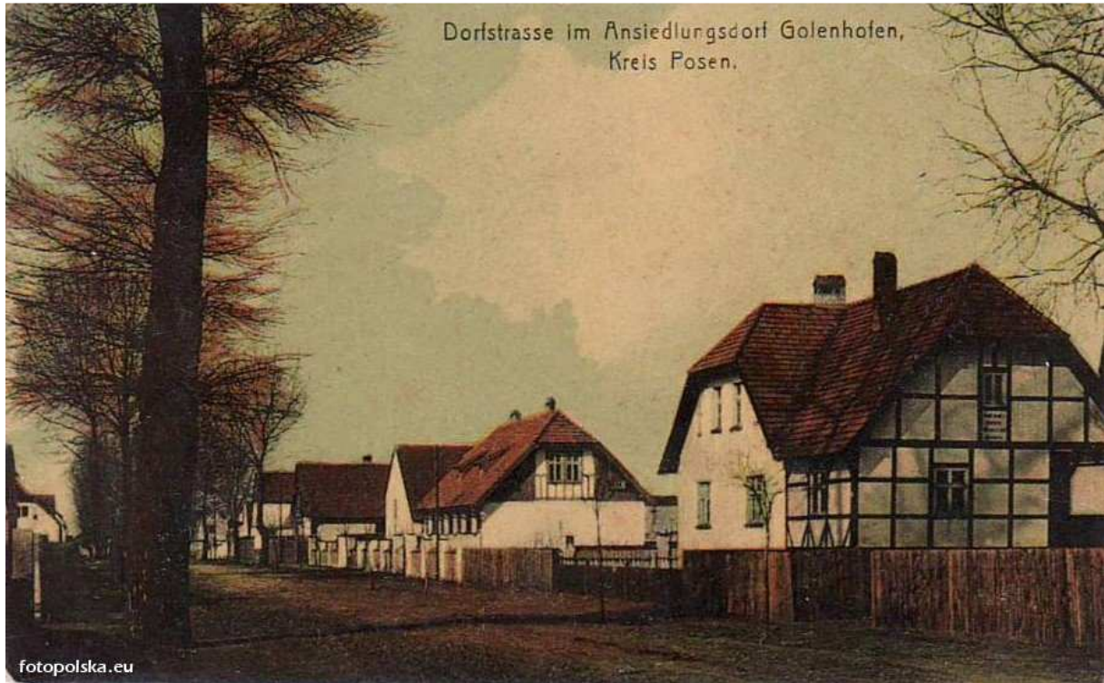
Golenhofen 1905 rok

zakątków Europy, zamieszkali w całkowicie wykończonych, zaopatrzonych w bieżącą wodę, bardzo nowoczesnych, jak na owe czasy gospodarstwach. Zabudowania ciągnęły się po obu stronach drogi wysadzonej drzewami w tzw. „swobodnych zgrupowaniach”.