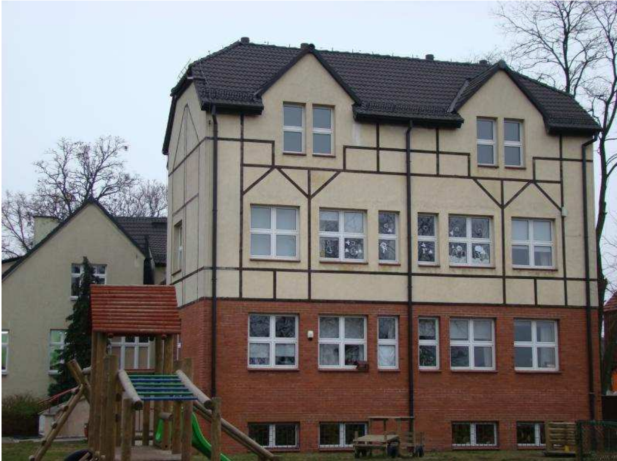
Rozbudowana Szkoła Podstawowa w Gołęczewie 2014 rok Architektura nawiązuje do wątku muru szachulcowego i ceglanego, charakterystycznego dla zabudowy wsi.

Od 1997 roku w Gołęczewie działa klub piłkarski GKS Gołęczewo.