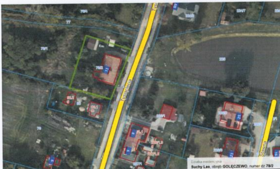
Mapa nr 2 (suchylas.e-mapa.net), kolorem zielonym zaznaczono granice działki nr 78/2.