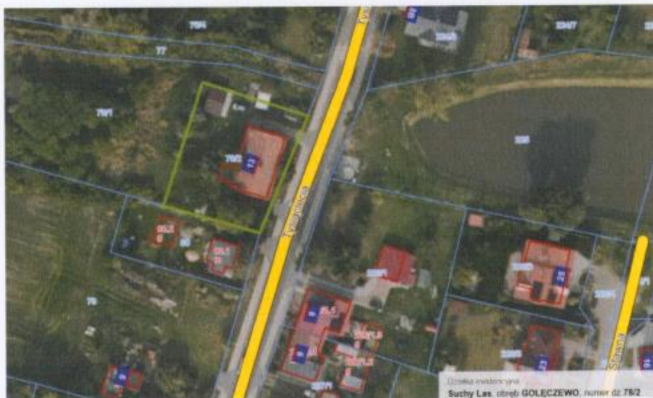
Mapa nr 2, kolorem zielonym zaznaczono granice działki nr 78/2