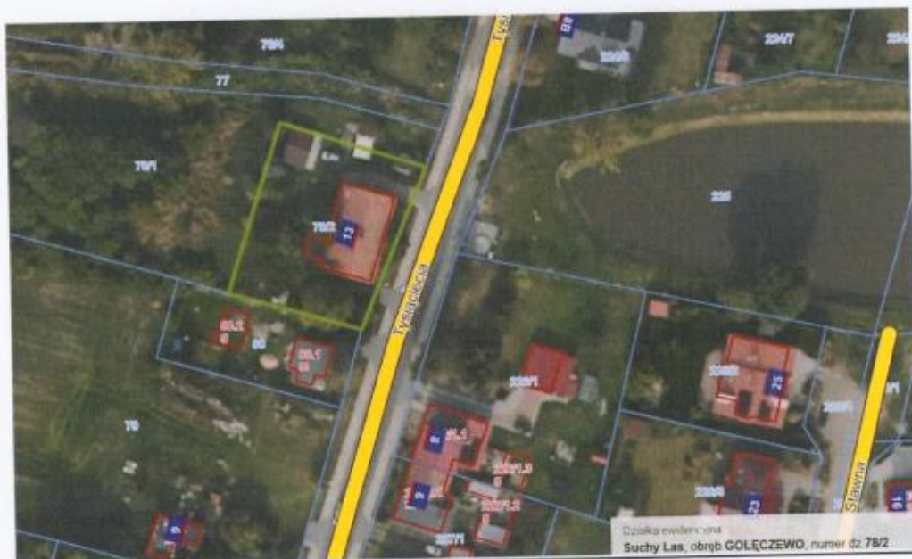
Mapa nr 2 (suchylas e-mapa.net), kolorem zielonym zaznaczono granice działki nr 78/2