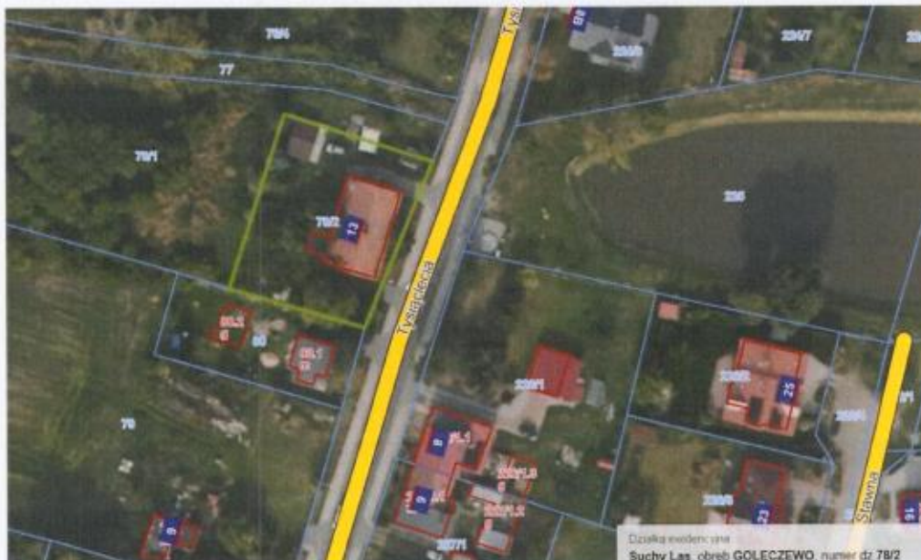
Mapa nr 2 (suchylas.e-mapa.net), kolorem zielonym zaznaczono granice działki nr 78/2