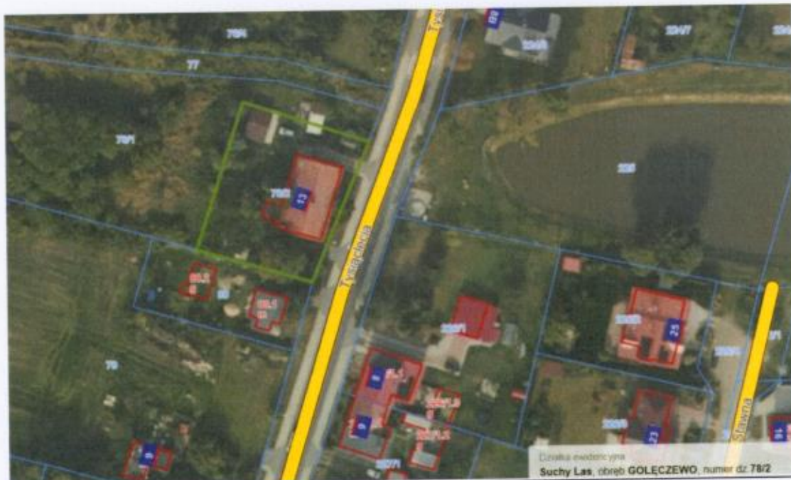
Mapa nr 2 (suchylas e-mapa.net), kolorem zielonym zaznaczono granice działki nr 78/2